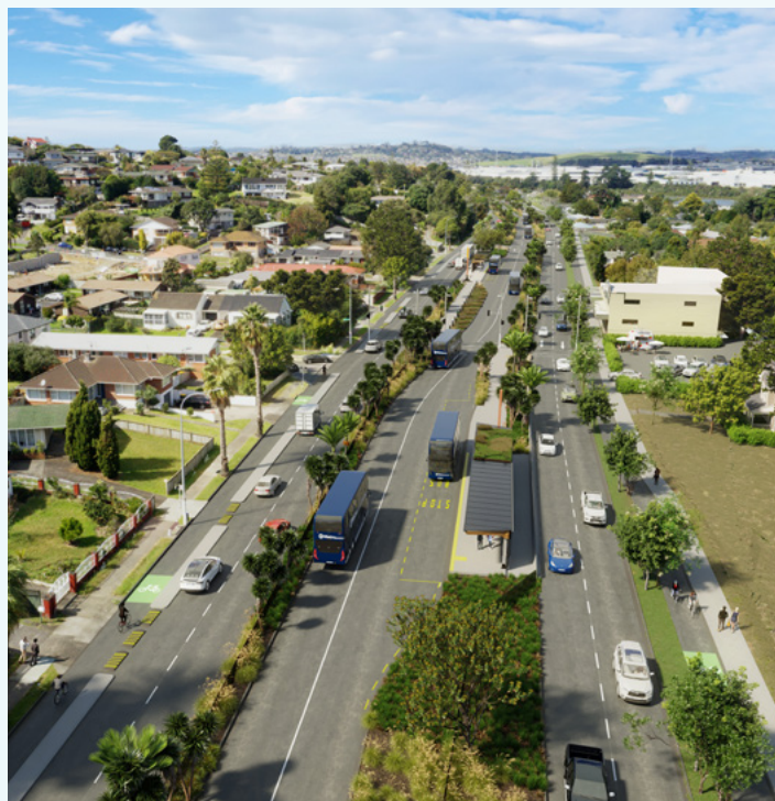
位于Tī Rākau Drive的公交专用道和Edgewater车站竣工后的艺术效果图

我们时刻谨记，我们在每一天做出的选择和行为都将对环境产生影响，因此项目组正在采取措施，确保减少我们对地球造成的影响。为确保采取可持续的工作方式，在与新的供应商或服务商合作之前，我们的团队将仔细考虑环境、文化、社会、经济等方面的影响。我们的其他关注领域包括：为奥克兰东部的个人和企业提供机会；合理利用资源；在项目建设期间减少对附近居民的打扰。这一切都是为了实现互帮互助而努力，为了社区和地球的福祉而努力。